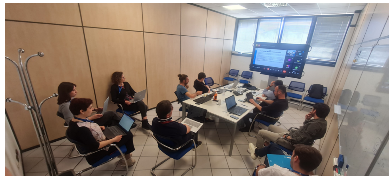
Nella foto in alto: il team Quality Industrial e il personale NSK a seguito della qualificazione.