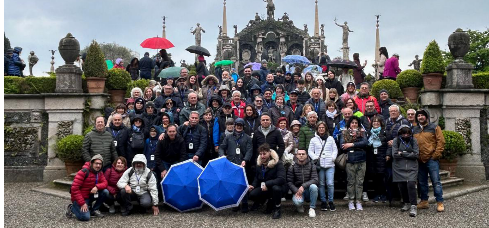
Il gruppo dei Soci CRAL alle Isole Borromee.

"Sabato 6 aprile, un nutrito gruppo di soci CRAL, ha trascorso una piacevolissima mattinata alla scoperta della Valle Castoriana di Norcia. Si tratta di una valle ricca di storia, situata proprio alle