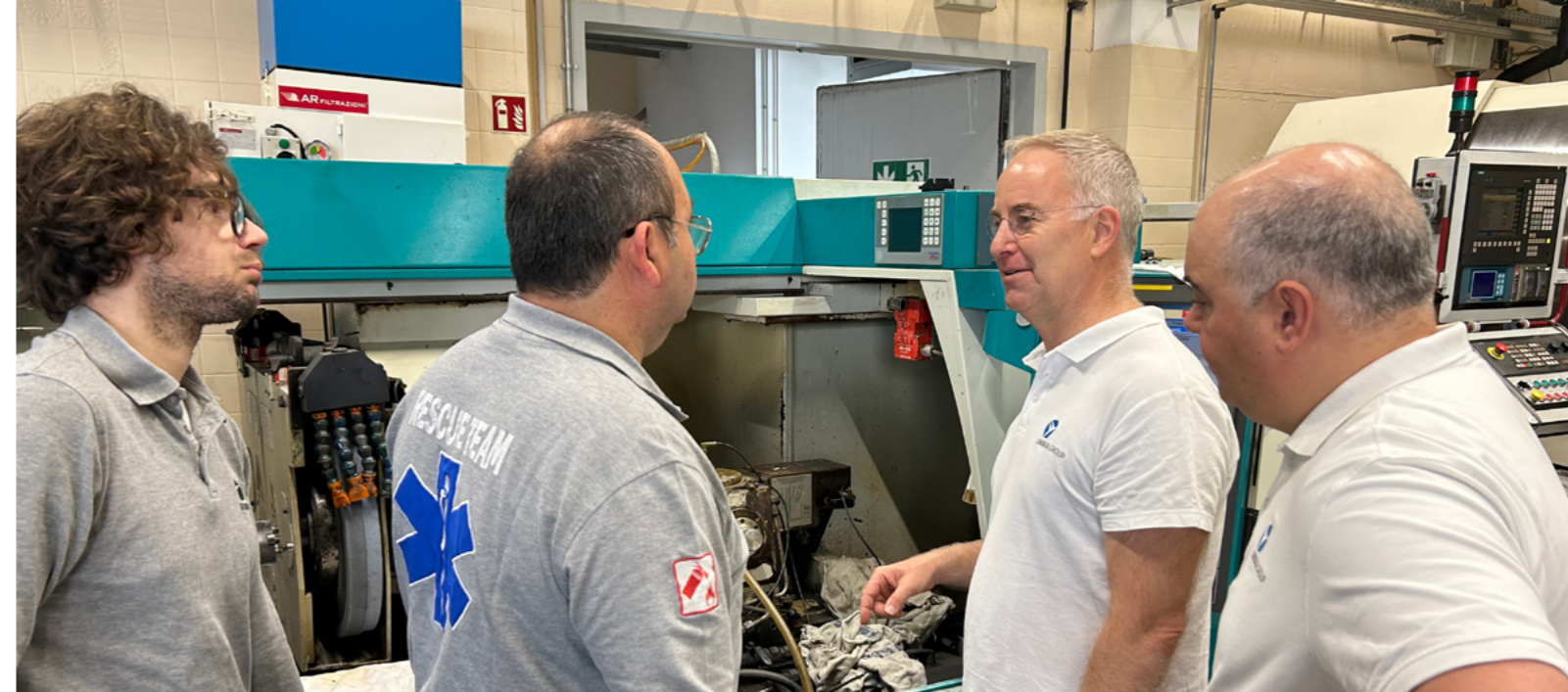
Il team cross-funzionale a lavoro sul 90 day plan.

Questo è soltanto il seme che stiamo gettando, affinché nasca il primo "S.W.A.T. Team" Aerospace (o "Squadra Mobile Aerospace", se preferite!), che porterà a più agevoli ed efficienti interscambi di informazioni tra le aziende del Gruppo, anche