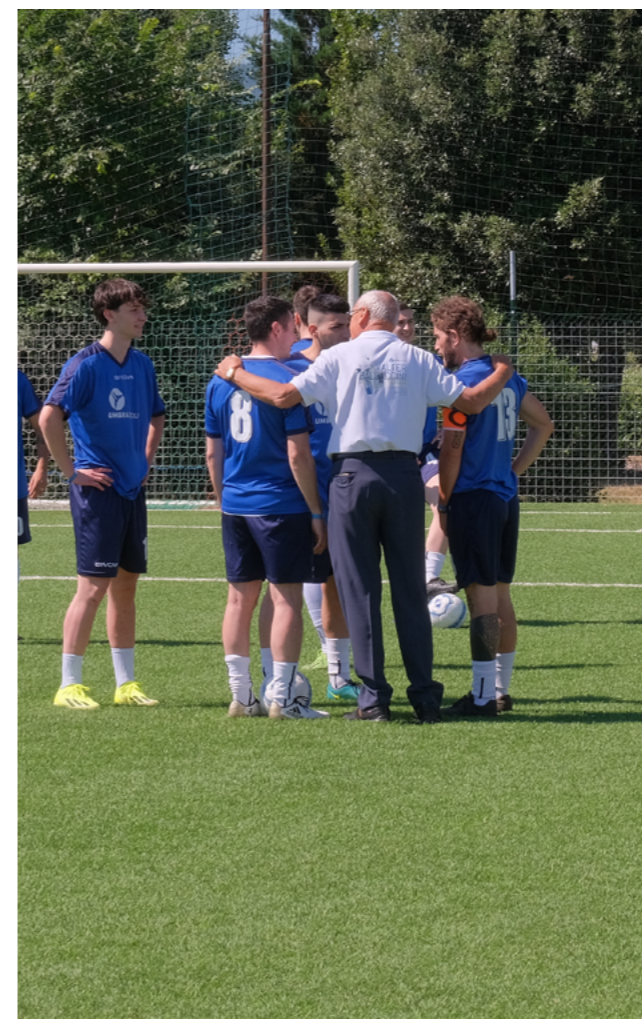
Nella foto a lato il team di UMBRAGROUP durante il Torneo Internazionale di Calcio del 15 giugno.

Your Self Development - Sviluppo di sé : Abbracciare il senso di responsabilità e lo sviluppo personale.