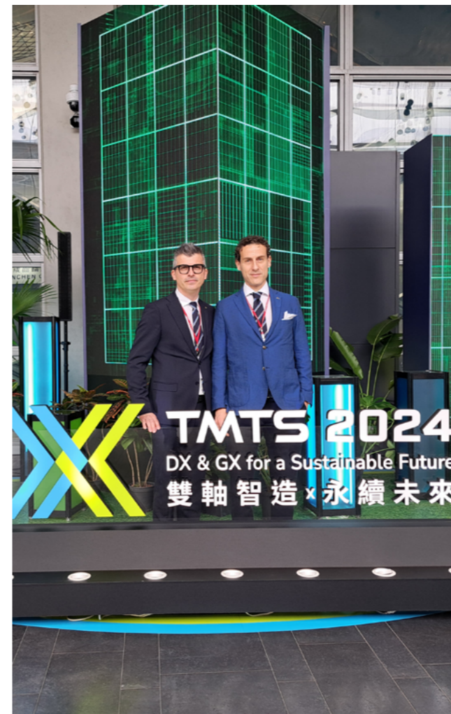
Il team Sales Industrial di UMBRAGROUP alla fiera TMTS di Taiwan.

Nella sfida tra alti carichi, accelerazioni ed affidabilità, UMBAGROUP risponde presente!