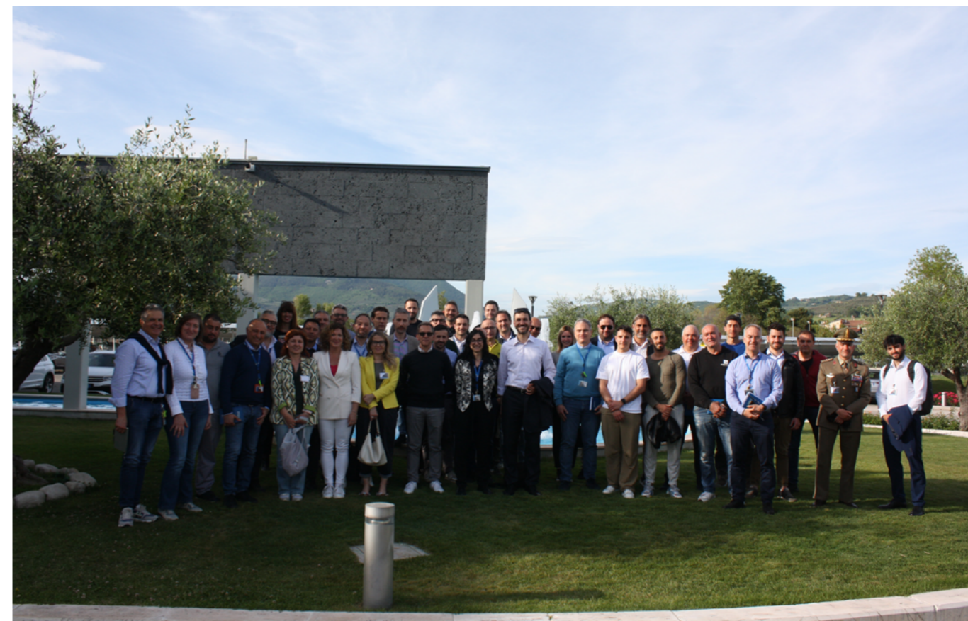
Il team di "Antropocene e le Sfide della Sostenibilità".

... una trasformazione che promette di elevare il nostro brand a livello mondiale.