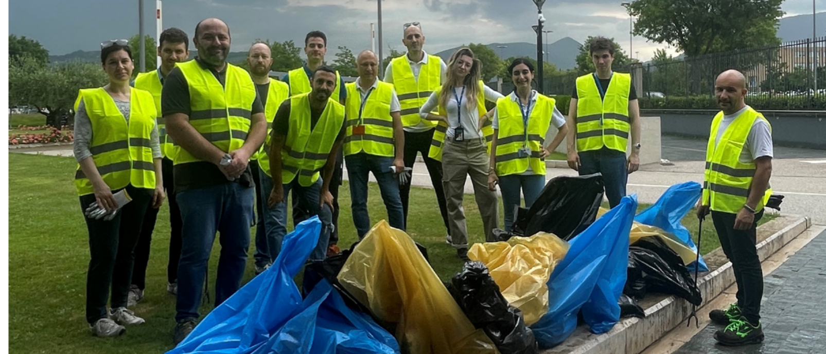
I collaboratori che hanno preso parte alla pulizia dell'area verde di UMBRAGROUP.

Ringrazio tutti coloro che stanno supportando in maniera costante l'implementazione di questi progetti strategici per lo sviluppo del business, che culmineranno nel secondo semestre, quando molti collaboratori di UMBRAGROUP saranno coinvolti nella formazione e nella piena comprensione delle nuove procedure che diventeranno standard. La partecipazione e l'impegno di tutto il personale UMBRAGROUP sono essenziali per il successo a lungo termine e per garantire i più elevati standard di sicurezza, qualità ed eccellenza, sia nel settore aerospaziale che industriale.