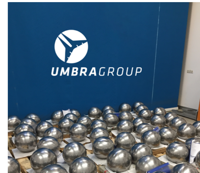
Le sfere di Eltmann.

Präzisionskugeln Eltmann ha accettato la sfida! Attraverso una collaborazione straordinaria