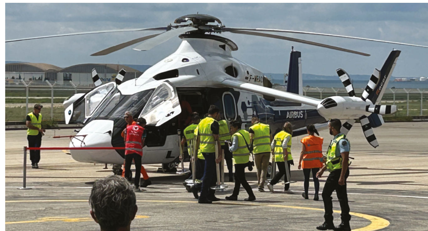
Presentazione ufficiale del RACER.

Questi velivoli ad alta velocità promettono, inoltre, di rivoluzionare la mobilità europea, consentendo di viaggiare tra due punti qualsiasi dell'Unione Europea in meno di quattro ore. Siamo veramente elettrizzati per questi progetti,