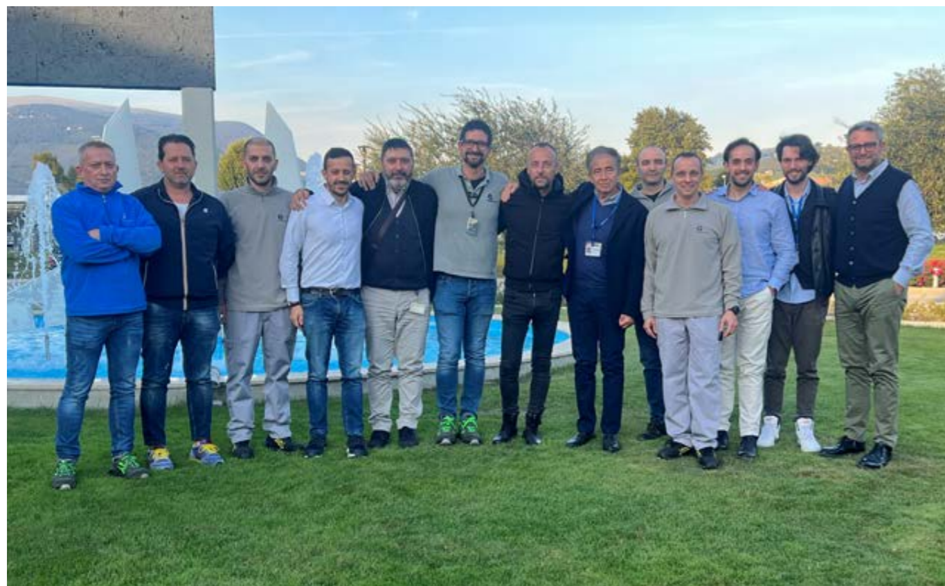
Il team Quality Aerospace al termine dell'audit NADCAP Trattamenti Termici.

Un piccolo mattoncino per costruire qualcosa di grande e solido, insieme”.