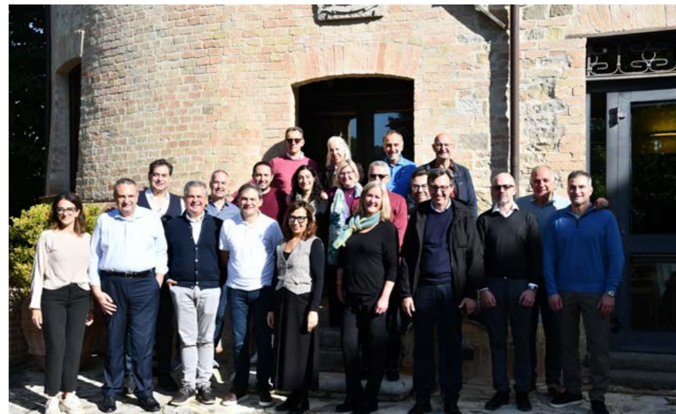
L'Executive Leadership Team al termine dei tre giorni di meeting.

Il primo giorno è servito per favorire una conoscenza reciproca dei partecipanti attraverso un'attività apparentemente competitiva ma che si è rivelata risolutiva soltanto nel momento in cui si sono unite le forze dei due team "antagonisti".