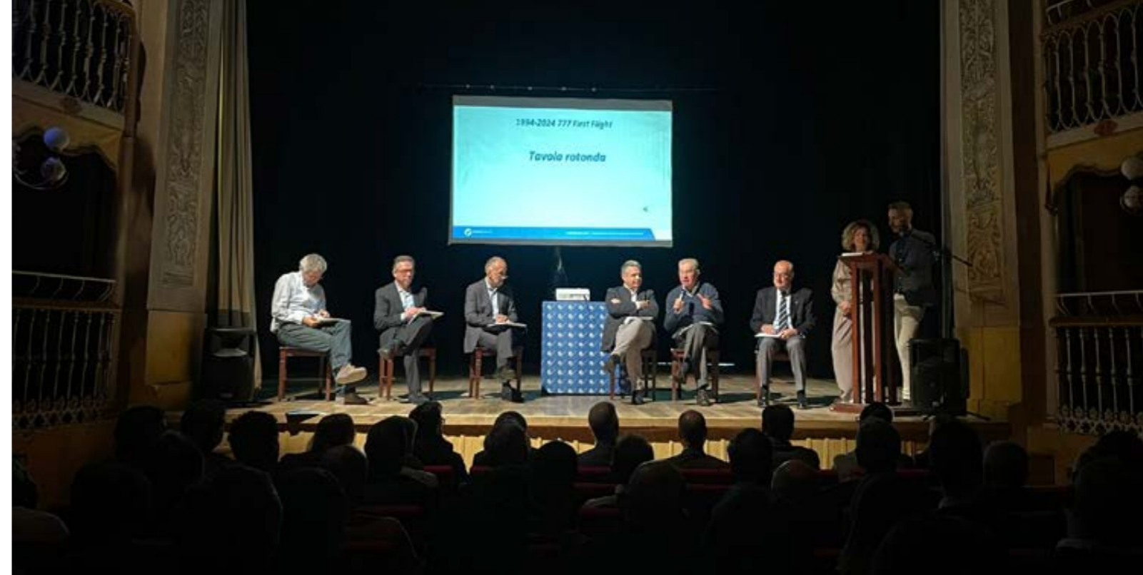
Un momento del Technical Meeting 2024.

Un momento memorabile di questo secondo semestre è stato certamente il 16 luglio, quando l'innovazione è letteralmente atterrata nella nostra