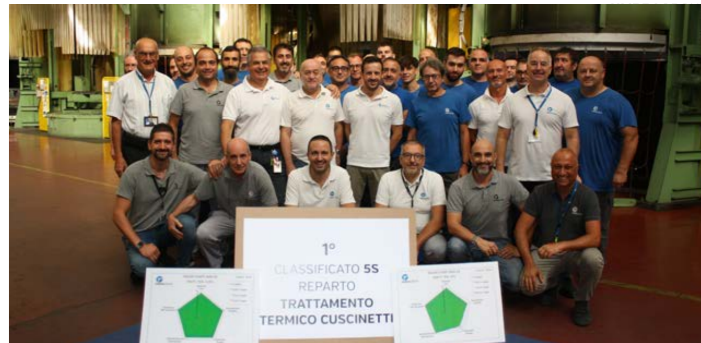
Premiazione al reparto Trattamento Termico Cuscinetti per l'annuale Audit 5S.

Il nostro processo di Continuous Improvement, supportato in primis da tutto il Management di UMBRAGROUP e poi dal prezioso aiuto di consulenti esterni, ha avuto come principale progetto il Supply Chain Transformation, denominato Symphony. Si tratta di un progetto ambizioso che prevede un cambiamento di paradigmi e modelli organizzativi, con l'obiettivo di ottimizzare tutti i miglioramenti prima a Foligno e successivamente trasferirli anche alle consociate, al fine di raggiungere un livello di eccellenza condiviso.