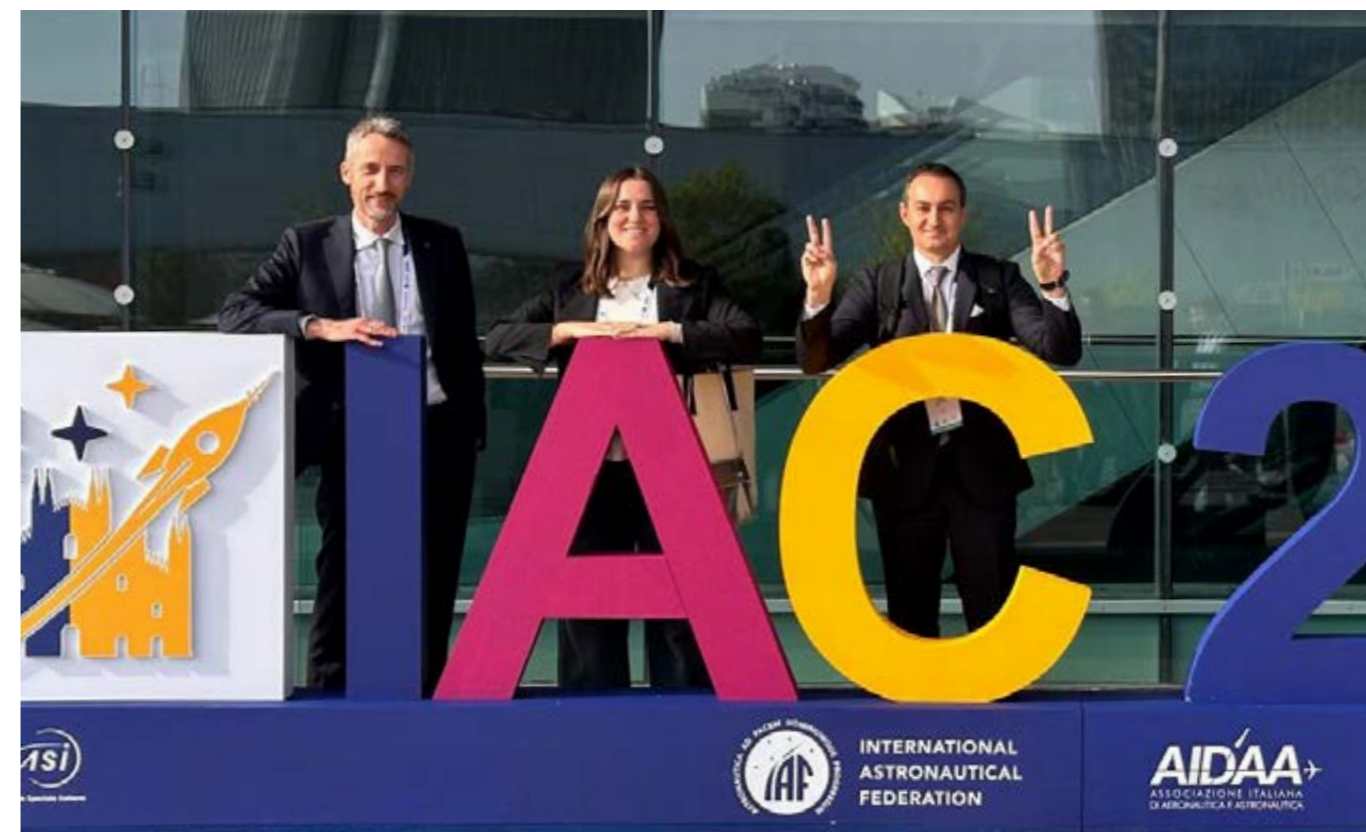
Il team di UMBAGROUP all'International Astronautical Congress.

È a loro che lascio quindi, nella parte più visibile dell'articolo, un sentito GRAZIE DI CUORE!