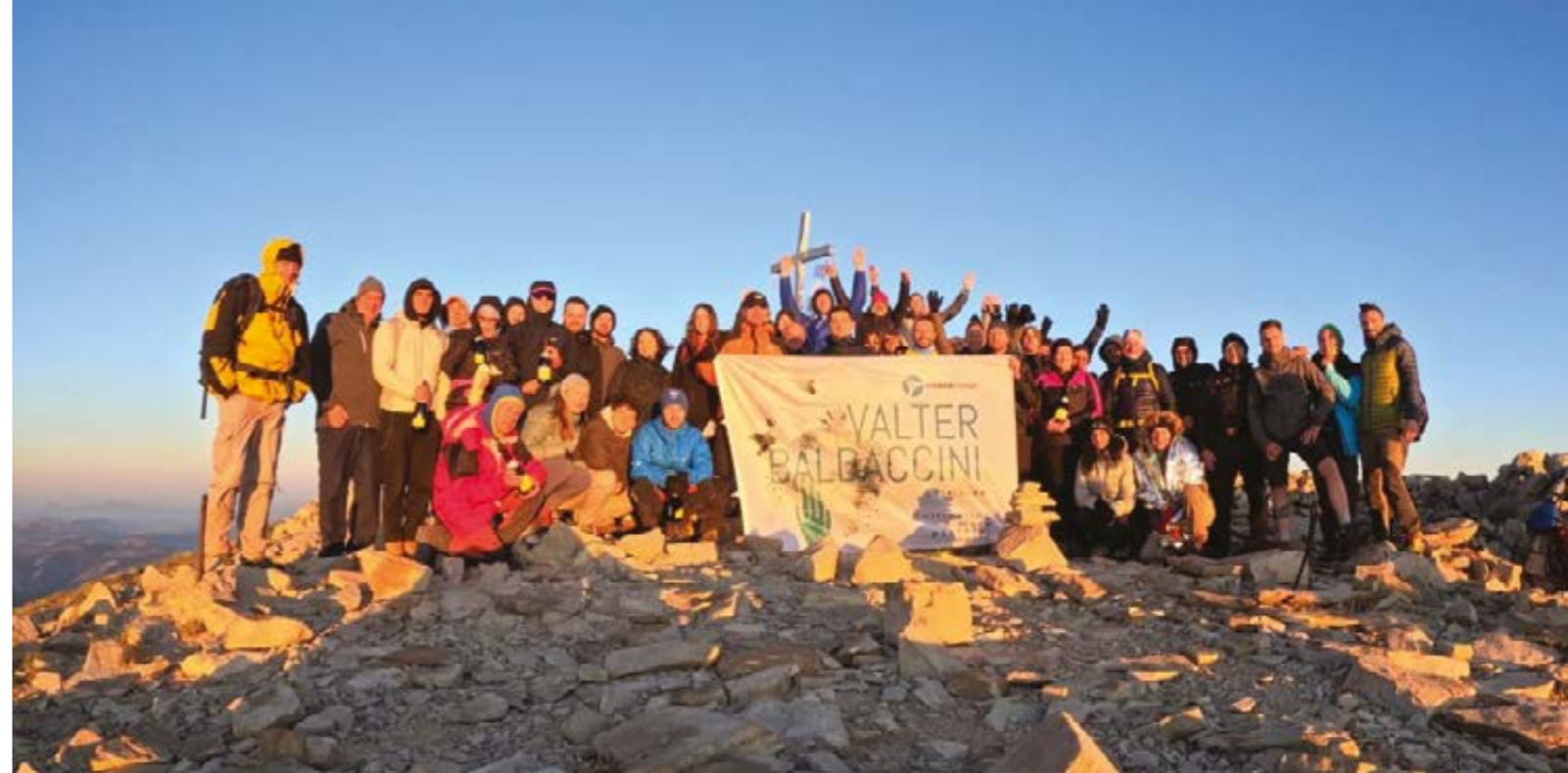
Il gruppo che ha preso parte all’ascesa del Monte Vettore il 20 luglio 2024.