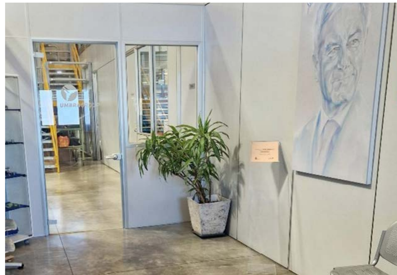
Il nuovo ingresso della sede di AMCo S.r.l.

Ogni team ha una propria autonomia e ad ogni lavoratore vengono riconosciuti i propri meriti, non solo per una soddisfazione personale, ma anche per essere da stimolo ed esempio ai colleghi. Il riconoscimento del lavoro, però, si struttura anche su una serie di premi, come ad esempio: un riconoscimento economico o tramite busta paga, oppure tramite i crediti Welfare e attraverso la partecipazione a corsi per accrescere non solo la formazione tecnica specifica al ruolo aziendale, ma anche il proprio bagaglio culturale. È altresì gratificante ed unisce lo spirito di Gruppo, avere occasioni aziendali per stare insieme, come partecipare a fiere e meeting che ci consentono di