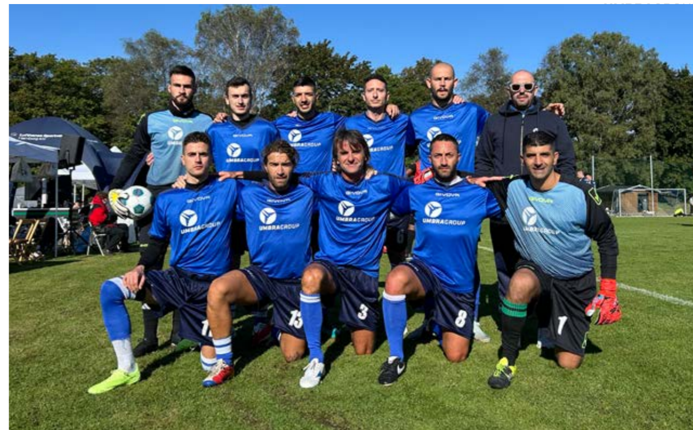
UMBRAGROUP Team durante il Football Tournament Lufthansa Sportverein.