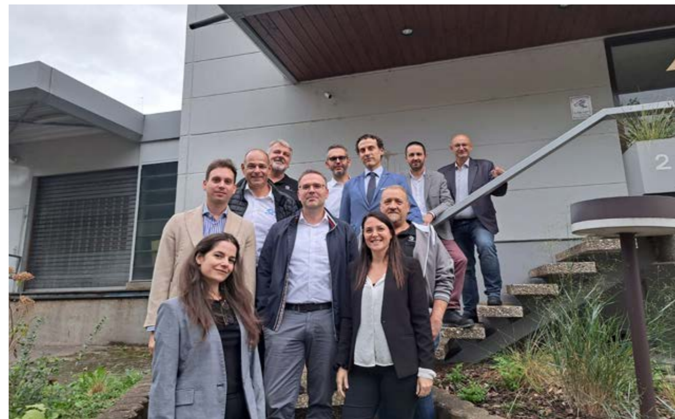
Il team Industrial al termine dell'Audit presso l'azienda KLINGELNBERG GmbH.

In questa seconda parte dell'anno, l'attenzione si è focalizzata su diverse iniziative, in questo numero del nostro Magazine, vi racconteremo le principali! Abbiamo condotto degli Audit presso le sedi dei nostri clienti, principalmente SCHAEFFLER