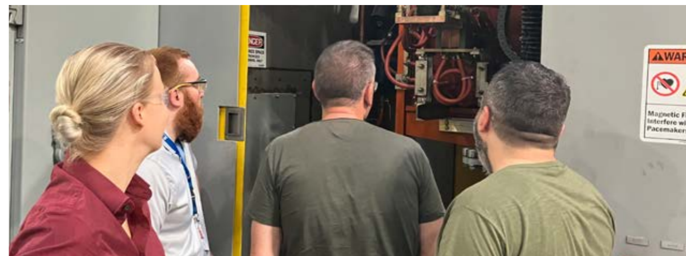
I team che hanno collaborato al miglioramento delle sedi americane.

formazione agli operatori. Ora siamo in grado di produrre viti HSTA di qualità e completamente in autonomia! Il miglioramento e la condivisione delle best practices, però, non si ferma. Infatti, il team continua a riunirsi settimanalmente per rendere il processo sempre più efficiente.