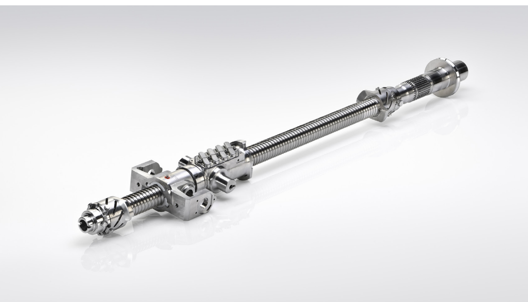
Vite a ricircolo di sfere per l'industria aeronautica.

Fondata nel 1972 Umbragroup è oggi un punto di riferimento globale nelle soluzioni di motion technology ad alta precisione per i settori aerospace, difesa e industriale. Con oltre 1.600 dipendenti, una presenza in più di 130 Paesi e undici